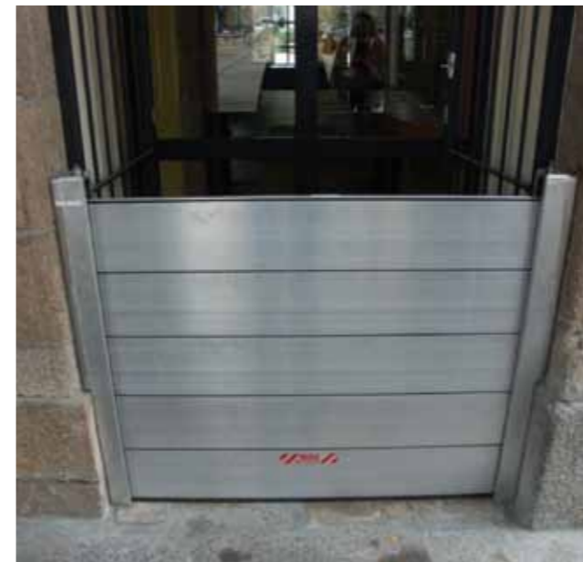
Mise en place d'un batardeau à la mairie de Morlaix.

Les services de la ville de Morlaix ont recensé toutes les ouvertures par où l'eau peut pénétrer dans les près de 300 bâtiments concernés. Les batardeaux à mettre en place représentent plusieurs centaines de mètres linéaires. La labellisation du PAPI permettra de mobiliser des financements pour aider les occupants à s'équiper.